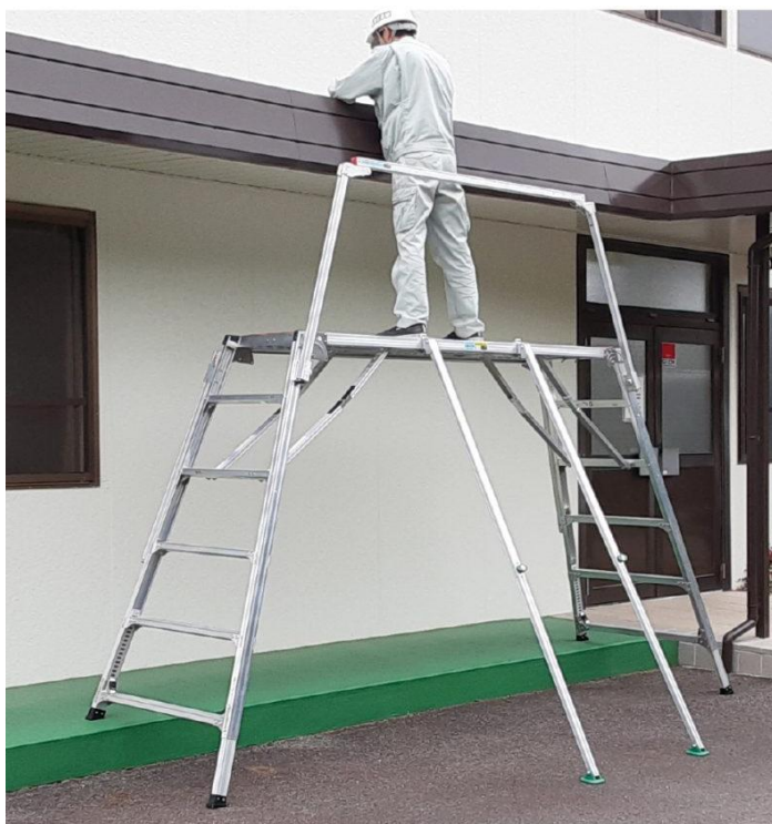
photo:ESK-20 × 2台 オプション ・ESK-20専用妻側一体式セーフティガード1本 ・ESK-20専用アウトリガー2本装着例

作業ポイントが約4mの高さでご使用できます。 アウトリガーを設置することで、転倒の抑制を行なうことができます。