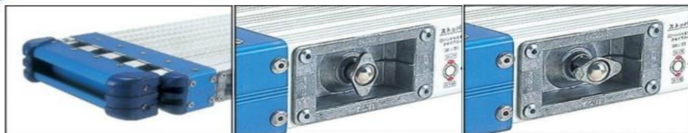
エンドキャップ付端部 ストッパーロック状態 ストッパーロック解除状態