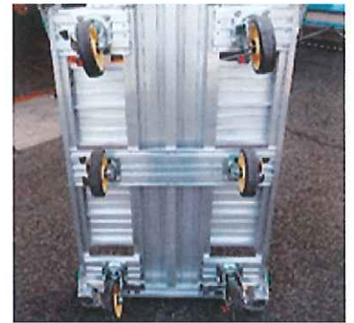
旋回ストッパーはロック解除で 自在キャスターになります 前へも横へも自由に移動