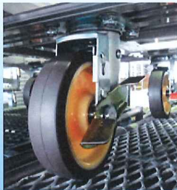
中央 旋回ストッパー (首振り固定)