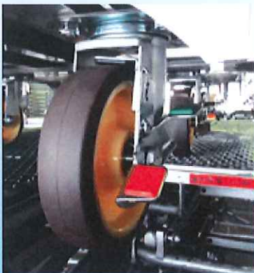
四隅 回転ストッパー (ブレーキ)