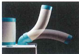
お好みの角度にダクトの可動範囲内にて変更可能です