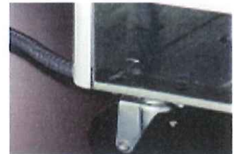
ドレンホースで直接排水もできます