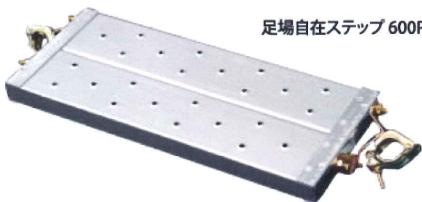
足場自在ステップ 600P